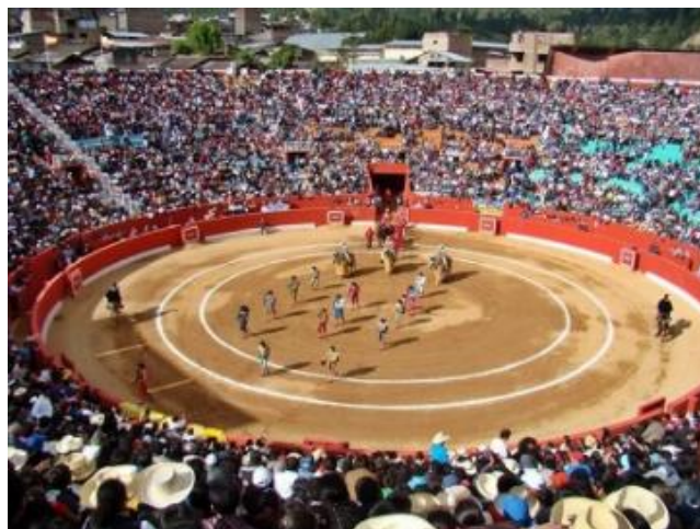
Imagen N°08: Plaza de toros el Vizcaíno

La corrida de toros se realiza los días 25, 26, 27 de junio en la Plaza de Toros El Vizcaíno, en donde diversas figuras del toreo internacional, llegan a la ciudad para hacer partícipe de la feria.