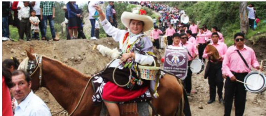
Imagen N°07: Concurso de la Flor del Chot