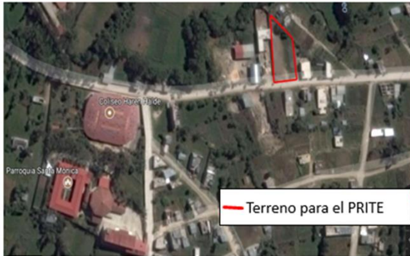
Imagen N°01: Ubicación del área del proyecto