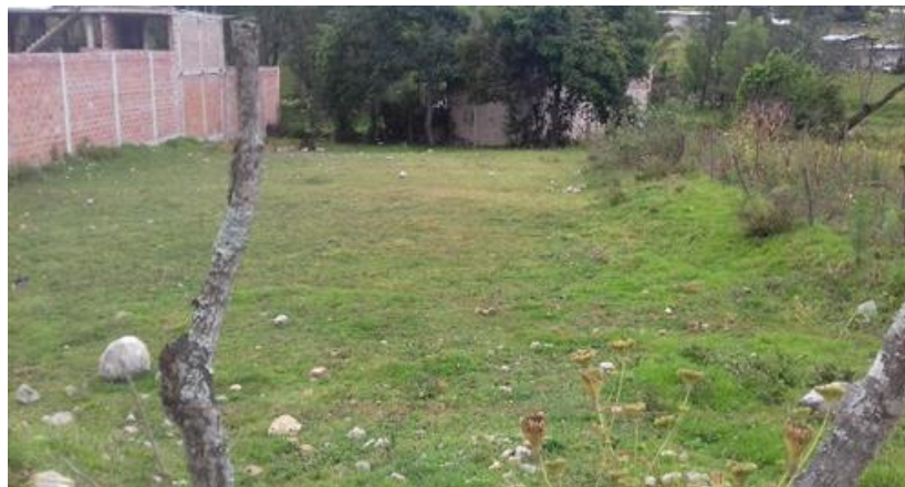
Imagen N°03: Flora existente en el área del proyecto

Dentro del área de emplazamiento directa del proyecto existe actualmente vegetación propia de la zona sierra del Perú, como podemos observar hay vegetación silvestre: Aloe Barbadensis, Urtica, Planago Major, Taraxacum officinale, lechuga salvaje, Cynodon dactylon (césped), Eucalyptus, etc.