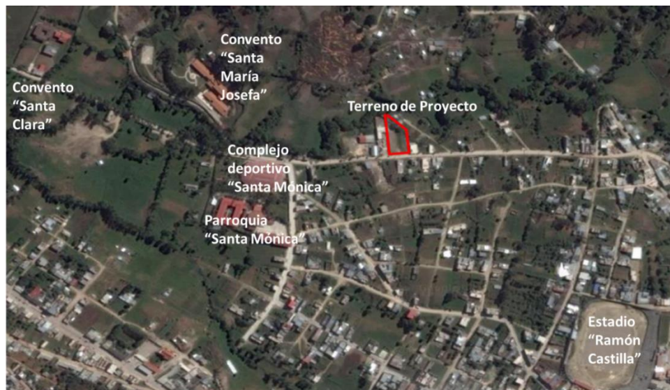
Imagen N°01: Área de influencia Ambiental Directa