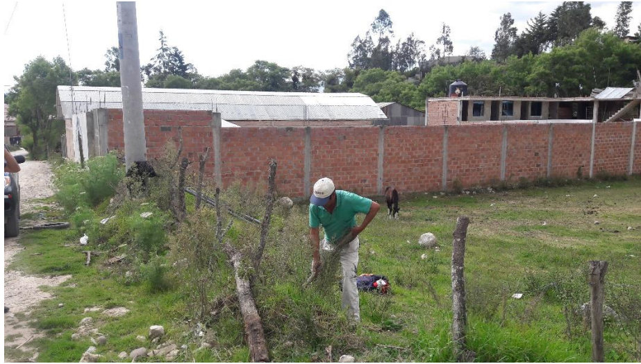
Imagen N°04: Fauna existente en el área del proyecto