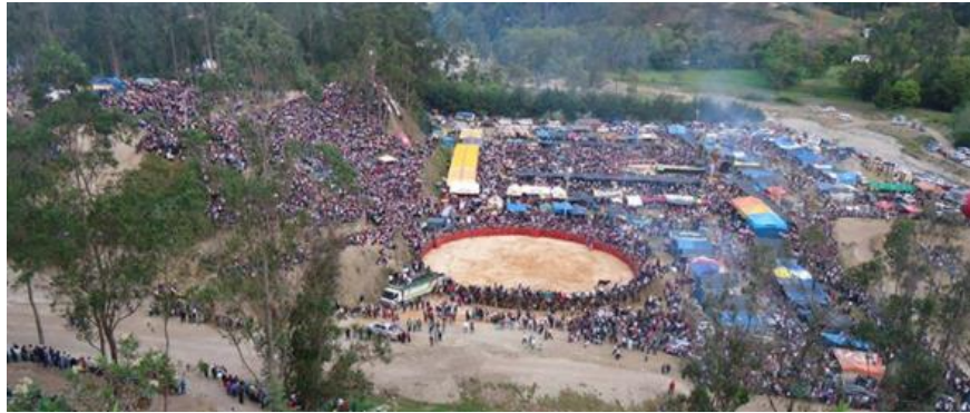
Imagen N°06: Feria de Sanjuanpampa