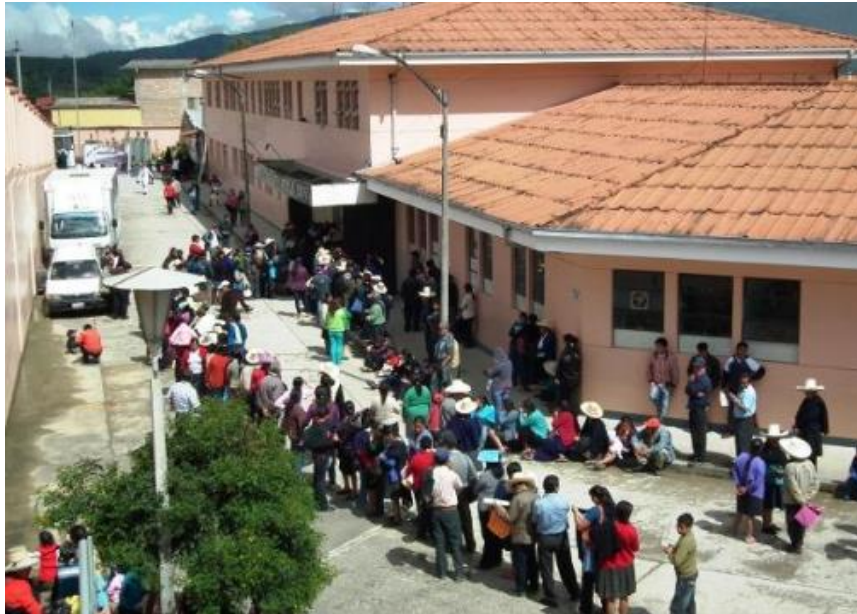
Imagen N°05: Hospital José Soto Cadenillas- Chota

Asimismo, existen postas de salud en los diversos caseríos y centros poblados, que prestan atención primaria de salud; además de un hospital Essalud, algunas clínicas particulares, entre otros centros médicos.